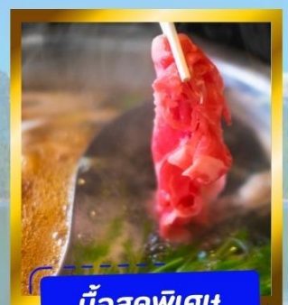
มือสุดพิเศษ