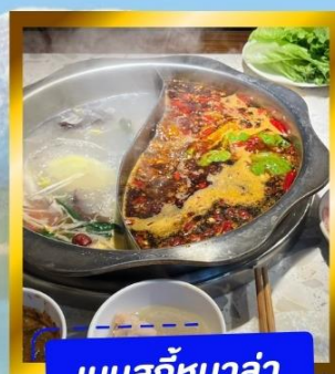
เมนูสุกั๋หมาล่า