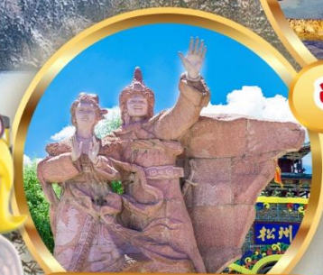
เมืองโบราณซงพาน