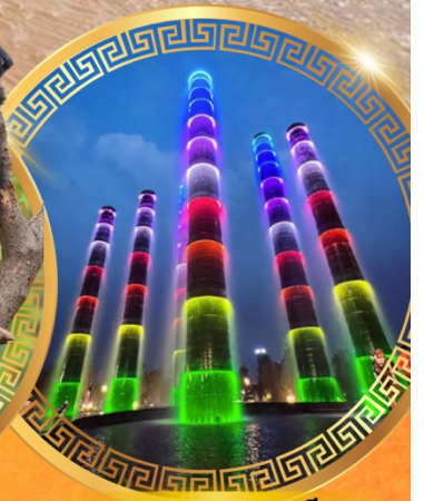
ชมการแสดงแสงสี