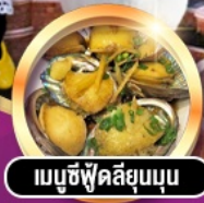
เมมูซี่ฟู้ดสิ่ยมูนูน