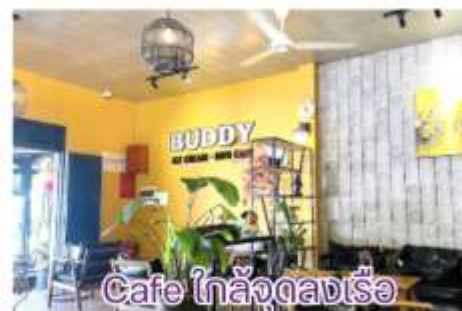
Cafe ใกล้ลงเรือ