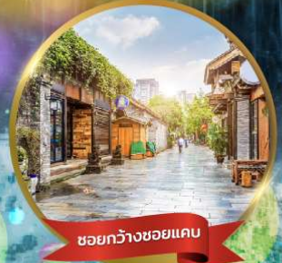
ชอยกว้างชอยแคบ