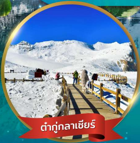
ต่ากู่กลาเซียร์