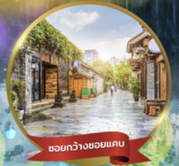
ชอยกว้างชอยแคบ