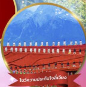
โชว์ความประทับใจลี่เจียง