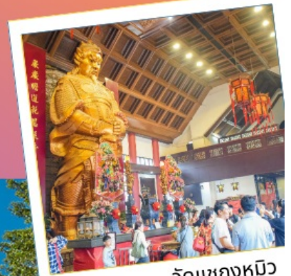
วัดเขangkงหมิว