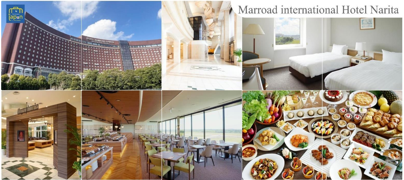
Marroad international Hotel Narita

MARROAD INTERNATIONAL HOTEL NARITA หรือเทียบเท่าระดับเดียวกัน