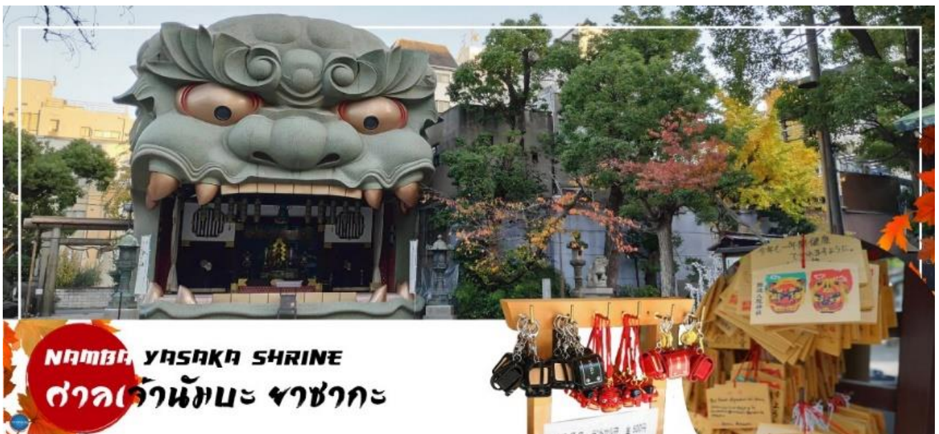
NAMBA YASAKA SHRINE

นำทุกท่านเช็คอินจุดถ่ายรูปที่ ศาลเจ้านัมมะยาซากะ (Namba Yasaka Shrine) ตั้งอยู่ในย่านนัมมะของเมืองโอซาก้า ไฮไลท์ของศาลเจ้าแห่งนี้เป็นรูปปั้นหน้าสิงโตอ้าปากขนาดใหญ่ ที่เชื่อกันว่า สามารถกลืนกินปีศาจร้าย หรือ สิ่งไม่ดีทั้งหลาย ให้หายไป และนำพามาซึ่งความโชคดีให้แก่ผู้คน ปัจจุบันนักเรียน นักศึกษา และผู้ประกอบการธุรกิจนั้น นิยมมาขอพรให้ประสบความสำเร็จกันที่นี่ ด้วยความสูง 17 เมตร ความกว้าง 11 เมตรและความลึก 7 เมตร อีสระให้ทุกท่านสักการะ และเก็บภาพที่ ศาลเจ้านัมมะ ยะชะกะ