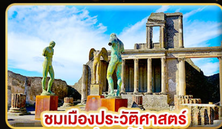
ชมเมืองประวัติศาสตร์ ปอมเปอี