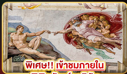
พิเศษ!! เข้าชมภายใน พิพิธภัณฑ์วาติกัน