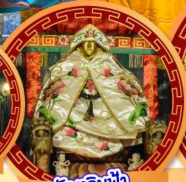
วัดเลินฟ้า