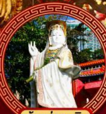
เจ้าแม่กวนอิม รีพัลส์เบย์