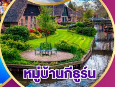
หมู่บ้านที่รูร์น

เดินทาง 30 เม.ย.-09 พ.ค. 68 03-11 พ.ค. 68