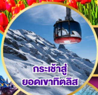
กระเช้าสู่ยอดเขาคิลิส