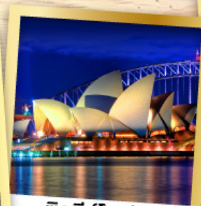
ซิดนีย์โอเปร่า