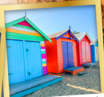
โบรด์วอล์ก บาร์ตัง บีกซ์