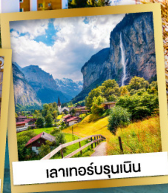
เลาเทอร์บรุนเนิน