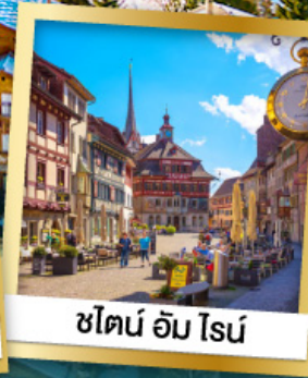
ชไตน์ อัม โรน์