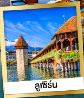
ลูเซิร์น