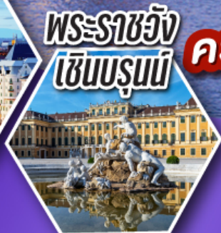
พระราชวัง เซินบรุนน์