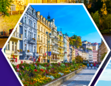
คาร์โลวารี