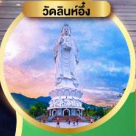
วัดลินห์ฮิ่ง