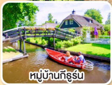
หมู่บ้านทึร์น