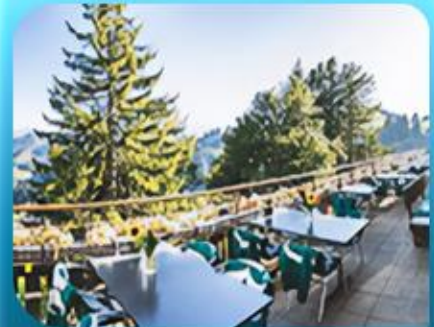
บทยอดเขาริกิ