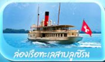
คองเรือทะเลสาบลูเซิร์น