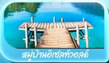
หมู่บ้านอิเชลทออลด์