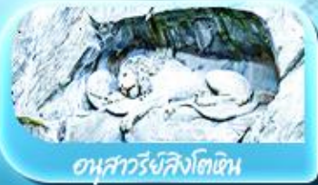
อนุสาวรีย์สิงโตหิน