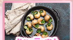
เมนูพิเศษ หอยเอสคาโท