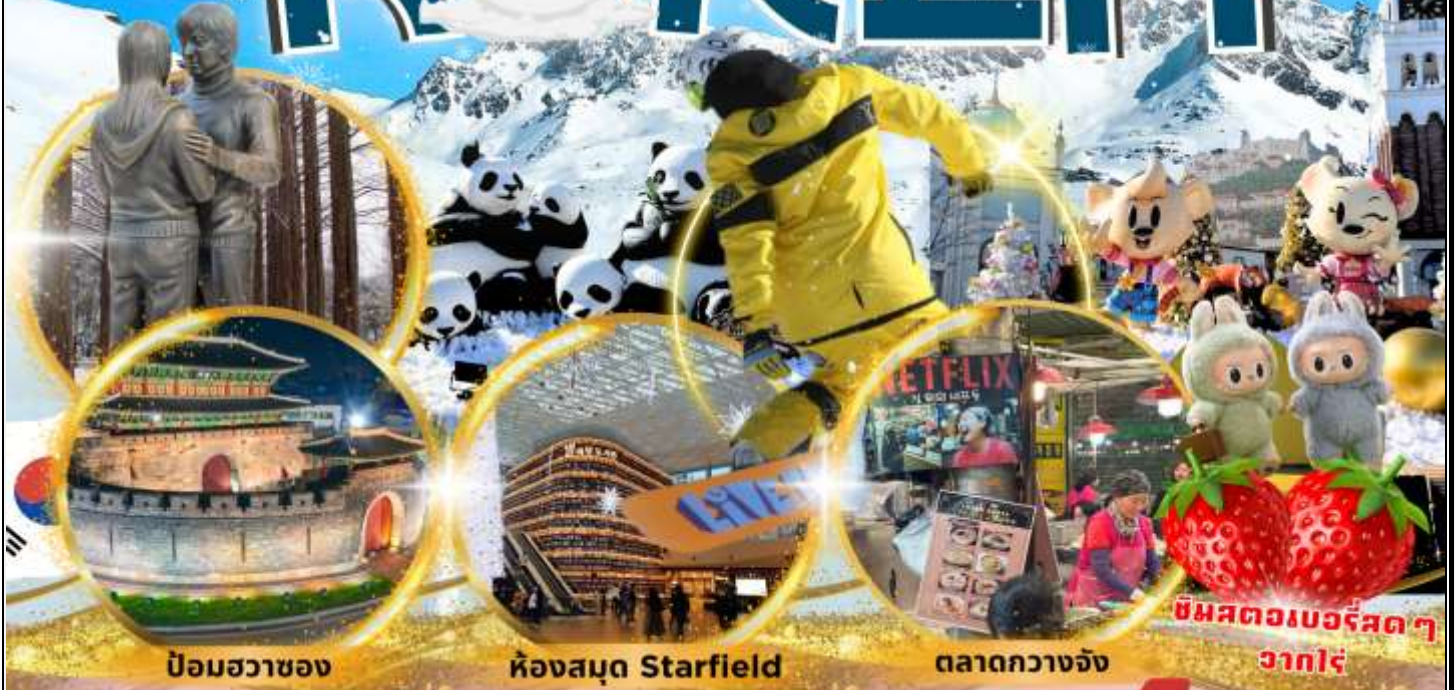
ป้อมฮวาซอง