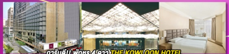
การันตี!! พิเศษ 4 ดาว THE KOWLOON HOTEL ติดถนนนาราน ย่านช้อปปิ้งจิมซาจุ่ย