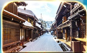
เมืองเก่าซันมาชิซูจิ