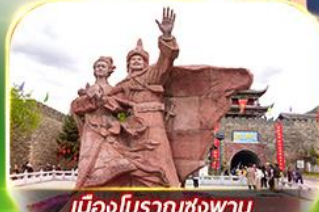
เมืองโบราณซ่งพาน