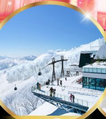
จุดชมวิว Unkai Terrace