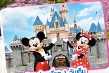
อิสระท่องเที่ยว 1 วันเต็ม