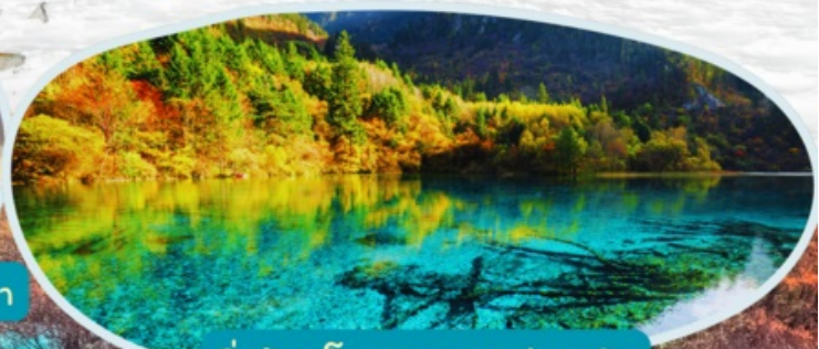
จิวจ้ายโกว รวมรถส่วนตัว