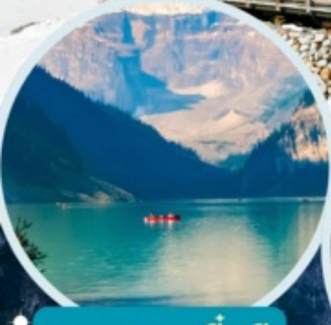
ทะเลสาบเตี้ยซี