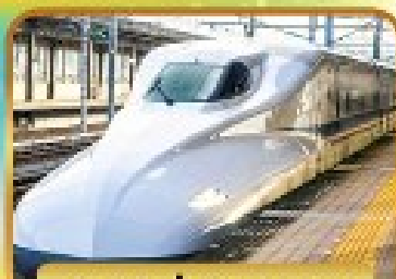
สั้มฟัสนั้งซึบกั้นเซน