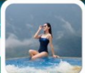
"พัก 4 ดาว PISTACHIO HOTEL"