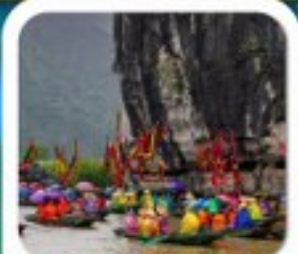
"ล่องเรือจางอาน"