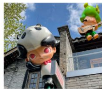
ถนนคนเดินซอยกว้างแคบ