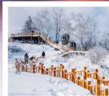
เขาเกาะหวู่