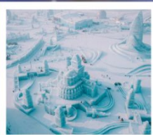
ICE AND SNOW FEST.