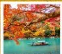
ฮารุชิมา