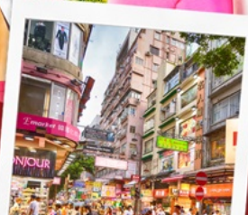
ช้อปปิ้งย่านมงก๊ก