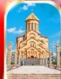
HOLY TRINITY CATHEDRAL