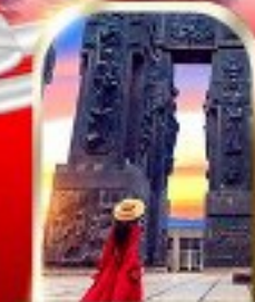
THE CHRONICLE OF GEORGIA