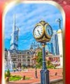
BATUMI CITY ADJARA

เมืองท้ำอูพลิสซิค ■ ป้อมอนาบูรี ■ นั่งกระเช้าชมเมืองบอร์โจมี อนุสาวรีย์มิตรภาพ รัสเซีย-จอร์เจีย ■ โบลด์เกอร์เกดี วิหารจวารี ■ มหาวิทยาลัยสเตรซ