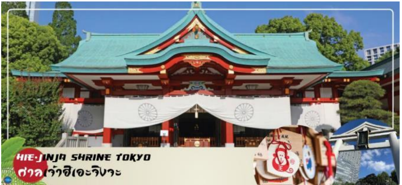
HIE-JINJA SHRINE TOKYO ศาลเจ้าอิเอะริงะ

เมืองนาริตะ – กรุงโตเกียว – ศาลเจ้าอิเอะ – พระราชวังอิมพีเรียล (ด้านนอก) – สะพานแวนดา – ย่านโอไดบะ – ห้างไดเวอร์ซิตี – ท่าอากาศยานนานาชาตินาริตะ