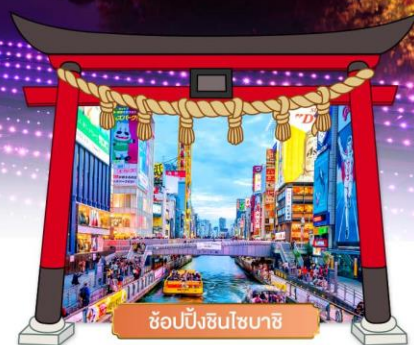
ช้อปปิ้งชินไซบาชิ

เดินทางโดยสายการบิน : ไทยแอร์เอเชียเอ็กซ์