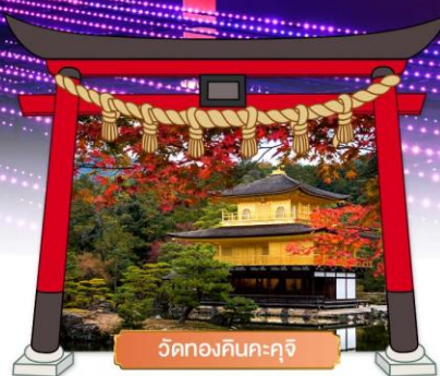
วัดทองคินคะคุจิ