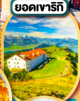
ยอดเขารีกี