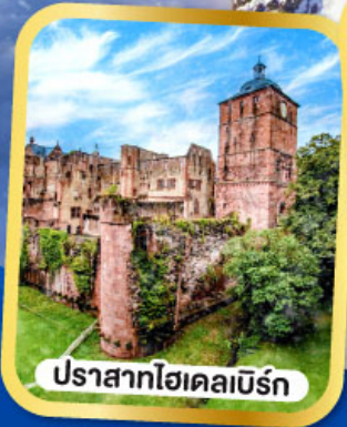
ปราสาทไชเคลเบิร์ก