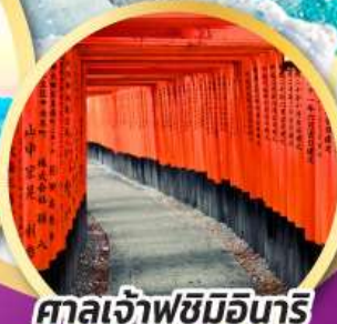
ศาลเจ้าฟูชิมิอนาริ