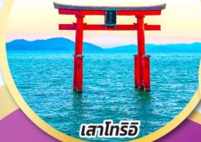
เสาโทริอิ