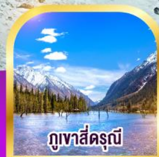
ภูเขาสี่ตรุนี