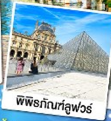
พีพีรภัทท์ลูฟวร์