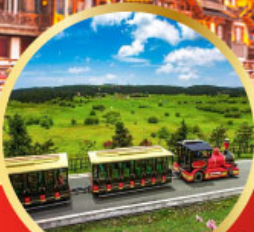
อุทยานเงาหางฟ้า