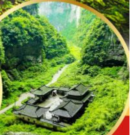
หลุมฟ้าสะพานสวรรค์