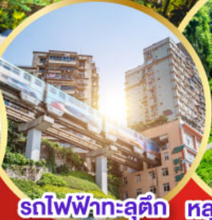
รถไฟฟ้าทะเลตึก หลุมฟ้าสะพานสวรรค์