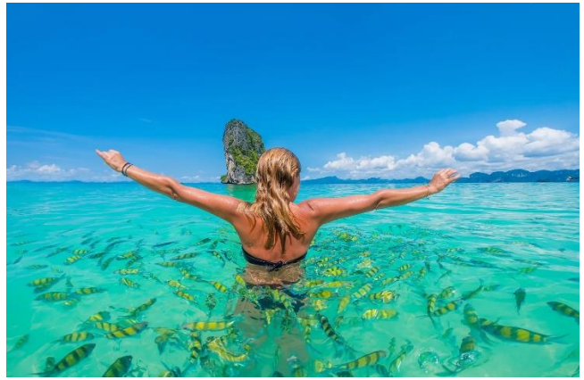
Sightseeing Thale Waek Unseen in Thailand