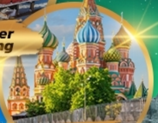
St. Basil's Cathedral