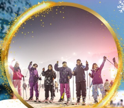
เล่นสกีสุดมันส์