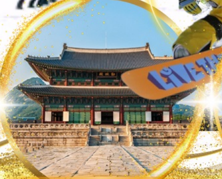
พระราชวังเคียงบกกรุง