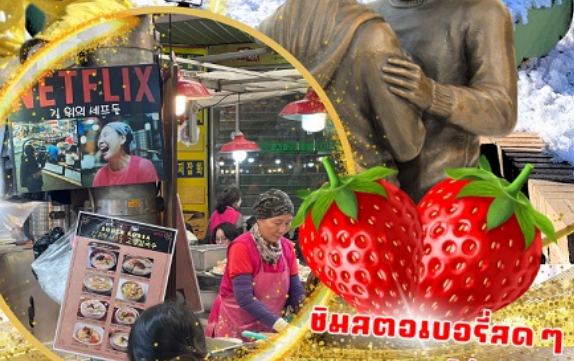
ตลาดกวางจง