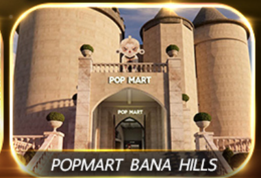
POP MART BANA HILLS

สัมพัสความงามหมู่บ้านฝรั่งเศสที่บานาฮิลล์ ซอปปิง POPMART