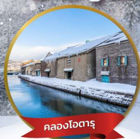
คลองไอตารุ

13-19 ม.ค. 2568 20-26 ม.ค. 2568 27 ม.ค. - 2 ก.พ. 68