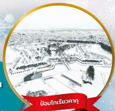
ป้อมโกเรียวกากุ