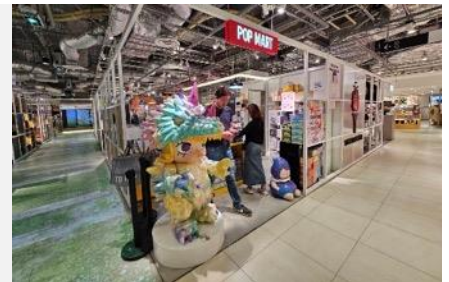
POP MART สายจุ่มถูกใจสิ่งนี้ !