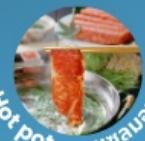
บุฟเฟ่ต์อาหารนานาชาติ